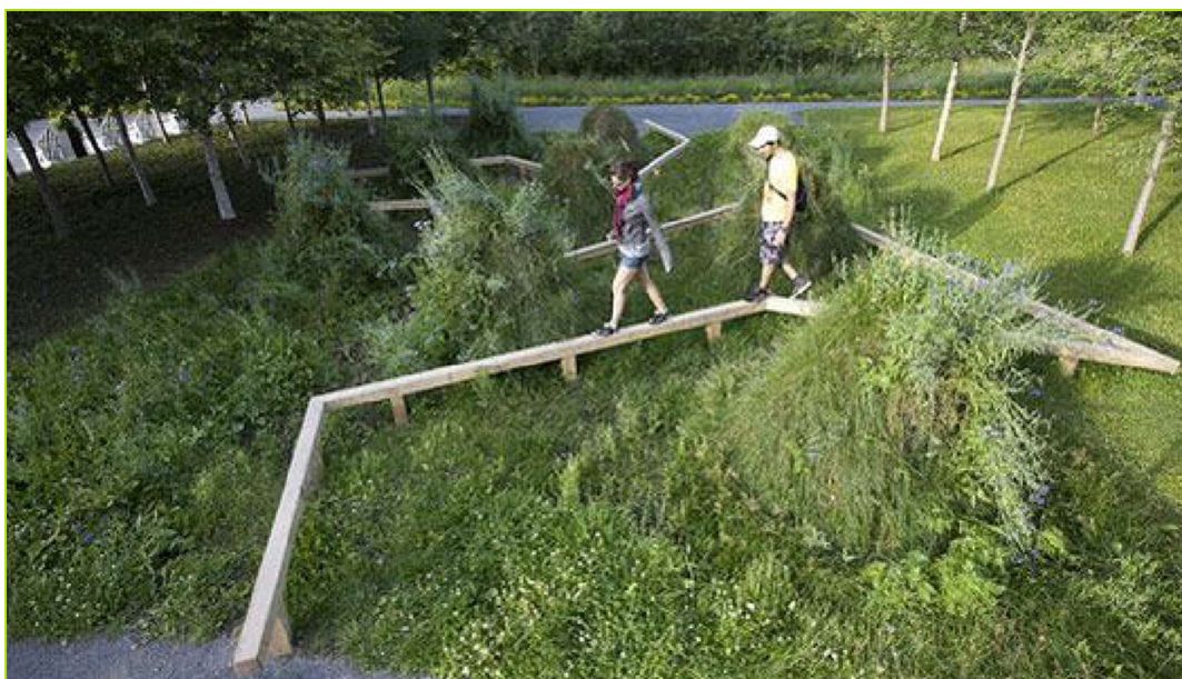
Figure 5 : Référence Legge, Double serpent nature walk, Grand-Métis Canada