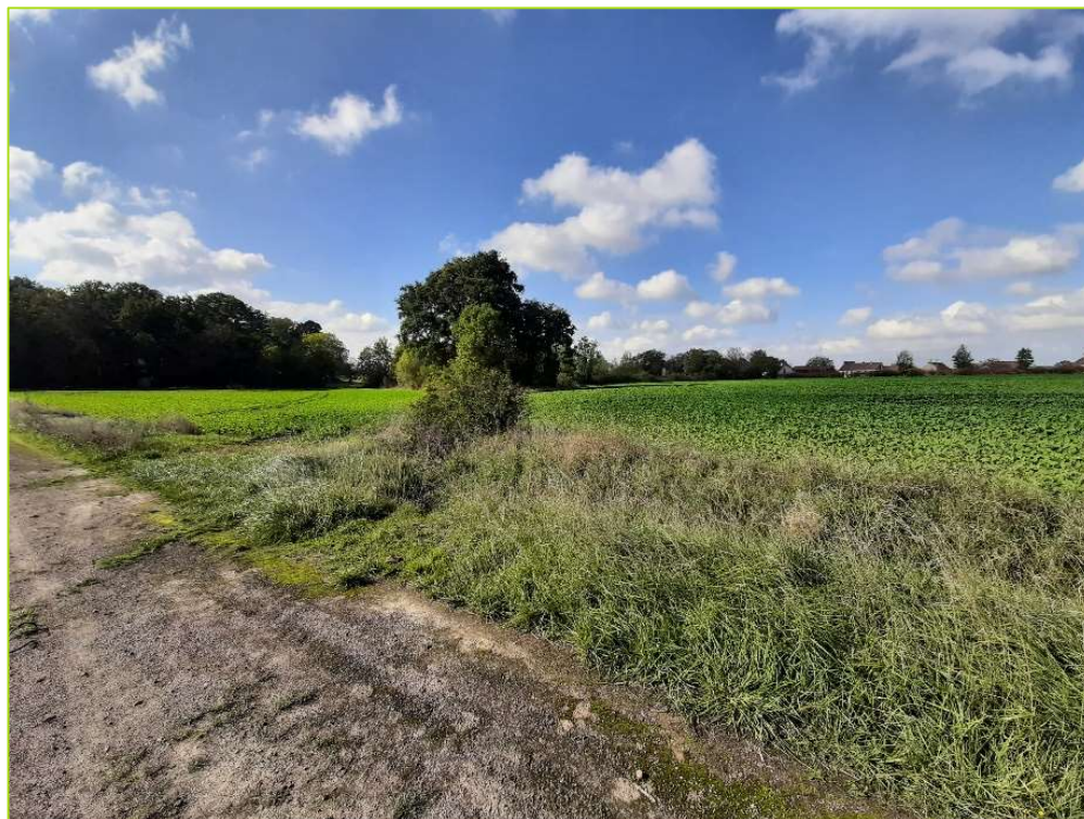
Figure 1 : Etat actuel du site d'étude